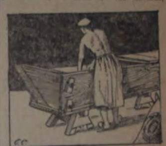
Amasando en la clásica bates

deben contarse asimismo entre las causas que determinan la precaria salud de los trabajadores del pan. El trabajo nocturno de los panaderos ha sido condenado por todos los higienistas, y sobre él se han escrito libros, folletos y artículos de periódico o revista en gran cantidad, ya tratando este asunto en relación con la salud de los obreros, ya juzgándolo como un problema de higiene pública.