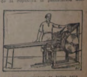
Máquina cortadora de bollos para galleta

pública, ha sido prohibido el trabajo de noche, o, por lo menos, "de toda la noche" en las panaderías.